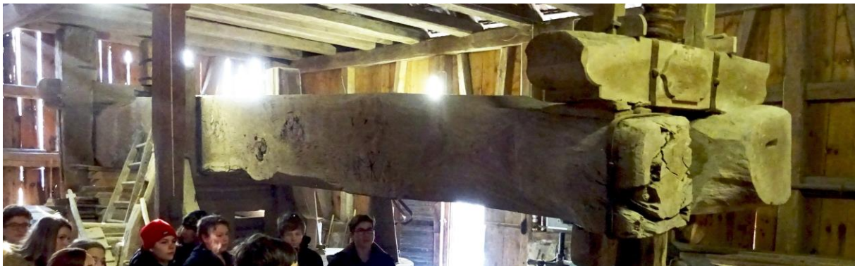
der heutige «Läderlitorggel» in Weinfelden mit einem 10 Tonnen schweren Trottbäum ist wohl etwa 500 Jahre alt

Hinter dem Haus der schon 1464 erwähnte Blattern-Torggel, in welchem gegen Ende des 18. Jahrhunderts der grösste und älteste Trottbäum des Landes lag. Er musste ersetzt werden. Den dazu benötigten Eichenstamm fand man in Wollmatingen. Am 11. Februar 1791 schleppten ihn 220 Männer, von Tambour Elias Hug in Schritt und Tritt gehalten, über den Seerücken. Gegen Ende des 19. Jahrhunderts ging der Rebbau stark zurück, die Weinpresse und den Trottbäum verarbeitete man zu Möbeln.