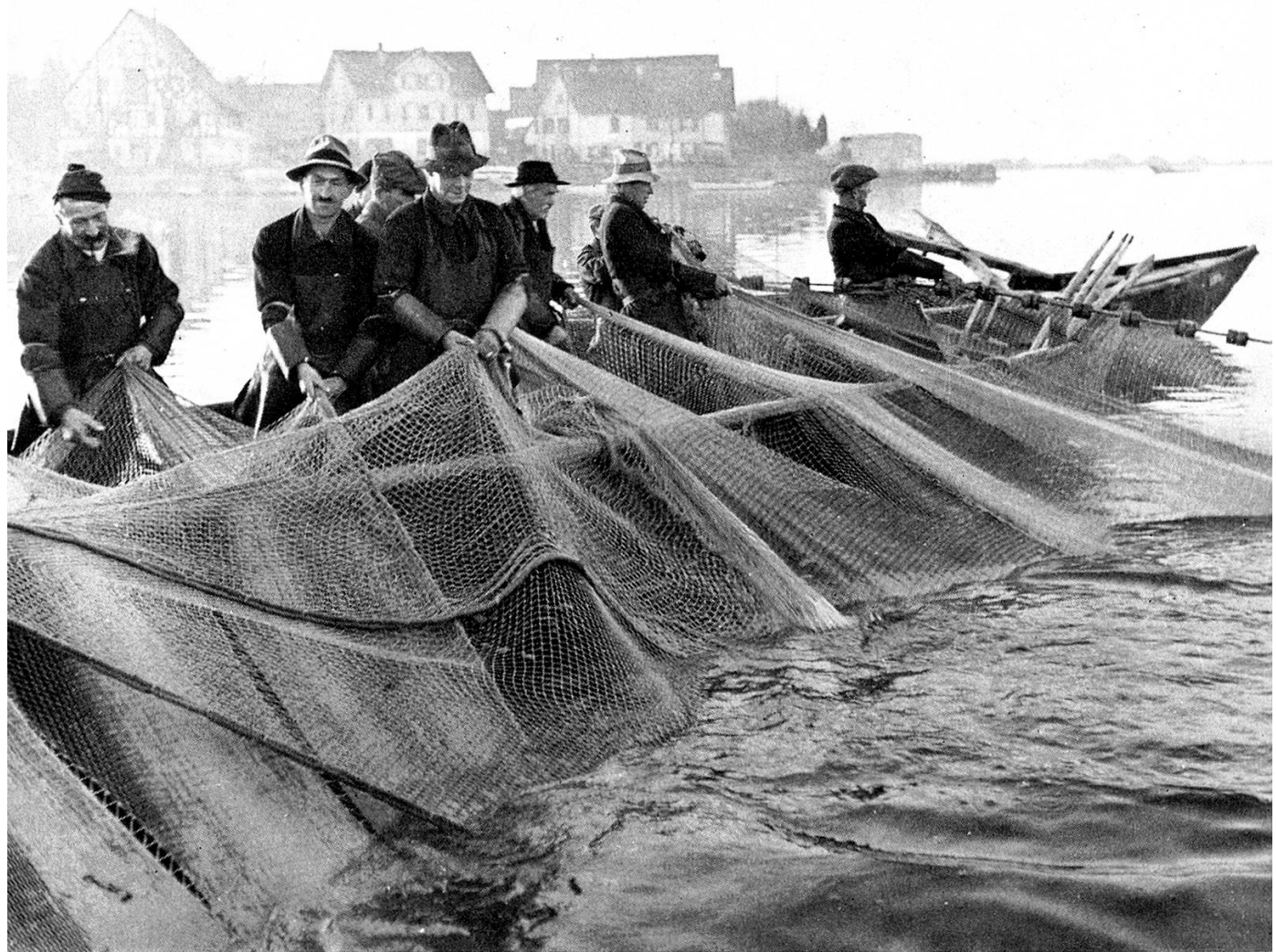
Die Segi wird eingezogen

Ist auch die andere Wand im Wasser, halten die beiden im Chöuffer-schääff ihre Überfeeri fest, bis der Segner wieder beim Vorbomm ist und mit dem Spa an diesem oder am Ankcher , dessen Seil auch Spa heißt, festgemacht wird. D Streckcher steigen nun in den Segner hinüber, um beim schweren Werk des Einziehens zu helfen; bisweilen bleibt einer im Strekchschääff . We 'sobald' mer aabindt , tond vier haschple , und di andere strekches noo ; di vorder Überfeeri wird mit em Haschpel , einem sägebockähnlichen Gerät, di hinder Überfeeri weiter von Hand eingeholt. D Chöuffer sind inzwischen mit dem Chöüfferschääff in den Kreis hineingefahren und beginnen mit Tribe – nur als Fischereiterminus hat das Wort immer ein kurzes -i- – und mit yhoue ; mit em Rueder und em Tribstäcke schlagen sie auf das Wasser, um die Fische in den Boge mit dem Sakch in der Mitte zu treiben. Bevor man aber das Garn einzieht, loot me de Zug verschwänkche , bis der Kreisbogen zu einem schmalen Schlauch wird, abgetrieben vom Wasserruus . Dänn fangt me wider aa züe , wäner verschwänkcht hät . Man holt an der Ober- und an der Underääri ein; wenn an dieser ein Stooa kommt, ruft der