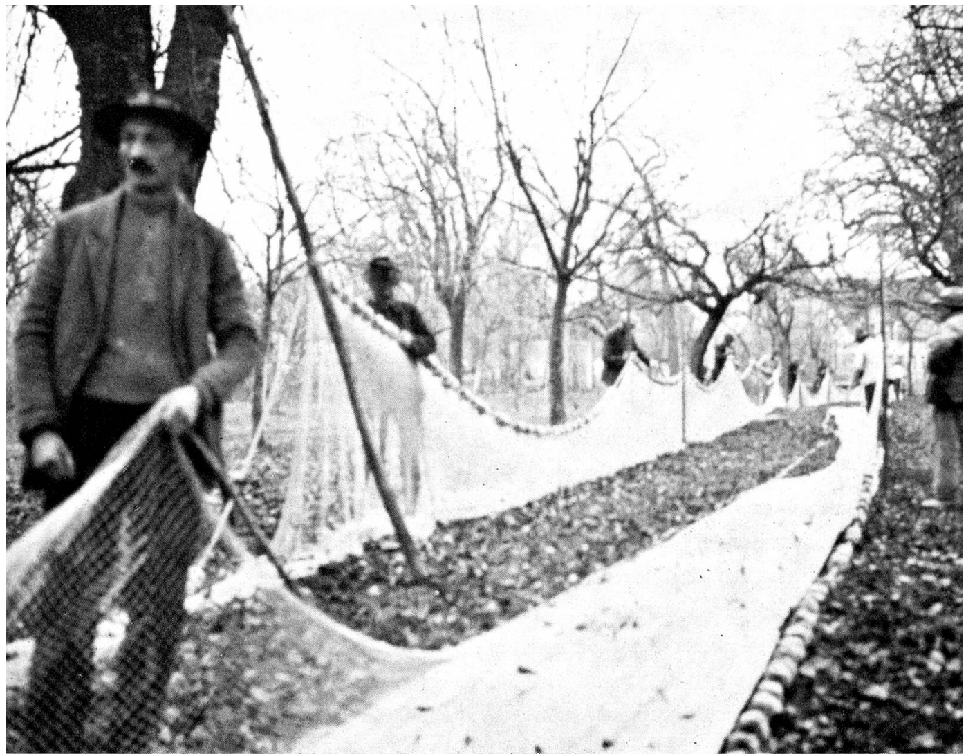
Vorbereitungsarbeiten der Segifischer

der Alpen wirklich aus dem Lateinischen stamme und nicht vielmehr direkt aus dem Griechischen ins Keltische und von da ins Französische und Deutsche übernommen wurde, sei es in Oberitalien oder auf dem Balkan; dabei ist vielleicht erwähnenswert, daß Aelian, der im 3. Jahrhundert nach Christus lebte, vom Welsfang mit der Sagēnē an der untern Donau zu berichten weiß. Weniger deutlich stellt sich die Frage bei zwei andern Wörtern. Griech. lagēnē , lat. lagena hieß ein Fäßchen für Wein, aber auch für Fische; als Lägele lebt das Wort in unserer Mundart weiter, allerdings nicht für den Fischtransport, dafür braucht man das flachovale Fischfäßli ; doch allgemein bekannt ist d Lachelägele 'Jauchefäß'. Gleicher griechischer oder griechisch-lateinischer Herkunft, von griech. pēra , lat. pera , ist de Beer , ein sackförmiges Netz, Fachebeer als Reuse und Schöpfbeer mit Stiel; in der Antike scheint keine Beziehung zur Fischerei belegt; pera war der lederne Brotsack der Bauern, Hirten und Jäger. In der frankoprovenzalischen Fischereiterminologie lebt es als bera weiter, doch auch in der bei uns üblichen männlichen Form ber .