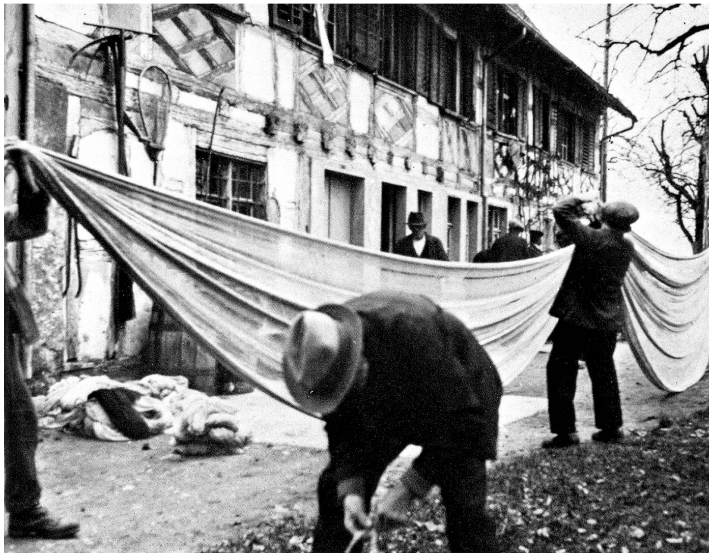
Die Segi wird zusammengemacht

sprache einer mehr oder weniger in sich geschlossenen Sprachgemeinschaft hat neben den eigentlichen Fachausdrücken auch Spracherscheinungen und Wörter bewahrt, die sonst in unsern Mundarten verschwunden sind. Die Sonderentwicklung des -ei- zu -ooa- gehört dazu. Beizufügen ist etwa noch, daß man im Stad wie in Triboltingen sagt chlää , en chlääne , chlääni 'klein, ein kleiner, kleine', während heute in der deutschen Schweiz fast überall chly gilt, im Gegensatz zu der ältern Sprache auch bei uns, in der ahd. chleini , mhd. klein gegenüber der im Mittelalter auftauchenden Nebenform klîn vorherrschte; Basel hat das dem chlää entsprechende glai beibehalten. Eine andere lautliche Erscheinung allgemeiner Art ist die Dehnung des kurzen -a- vor einem doppelten Sonorkonsonanten, der vereinfacht wurde; erhalten hat sich in allen deutschschweizerischen Mundarten überaal 'überall', während die Erscheinung in den meisten Fällen rückgängig gemacht wurde, besonders in der östlichen Schweiz. Karl Schmid wies in der «Mundart des Amtes Entlebuch im Kanton Luzern» Baal 'Ball', Faal 'Fall', Schwaal 'Schwall', Staal 'Stall'